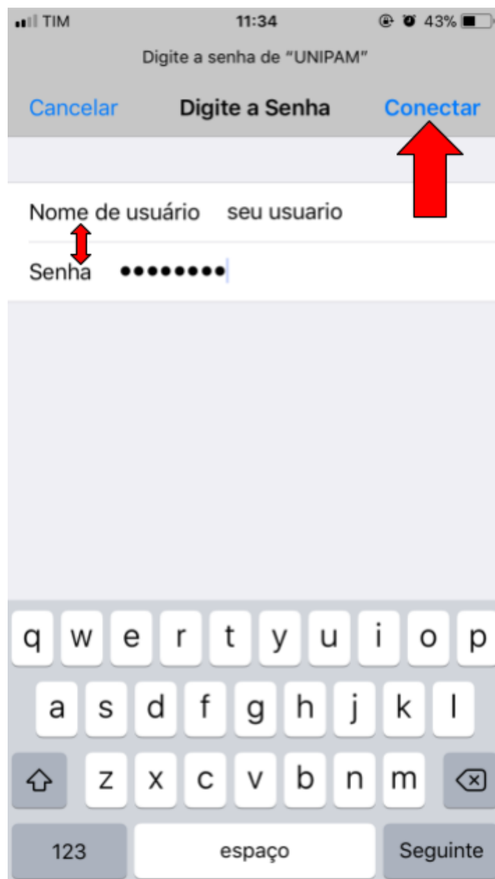
Figura 4 – Tela do iOS

4º Passo: insira seu usuário e senha e logo após clique em conectar .