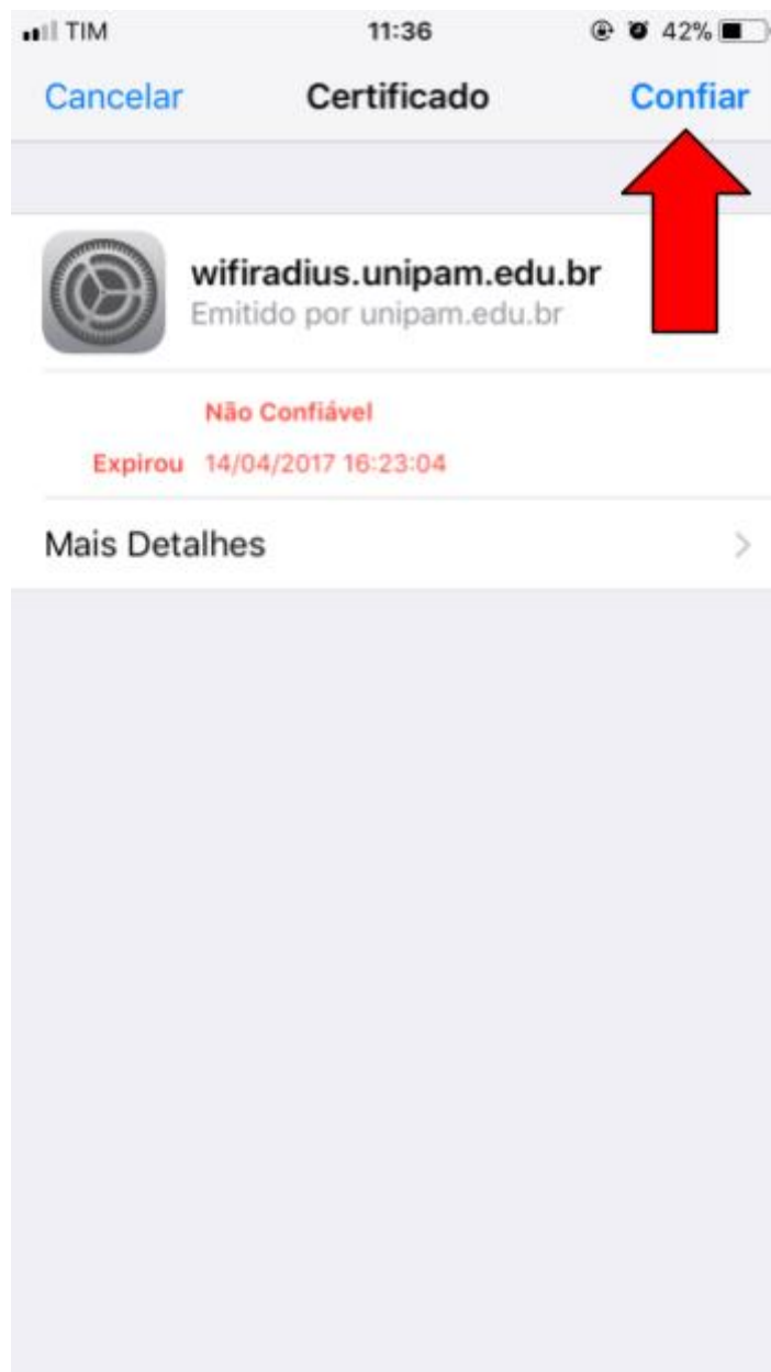
Figura 5 – Tela do iOS

5º Passo: apresentando a tela de Certificado , clique em Confiar .