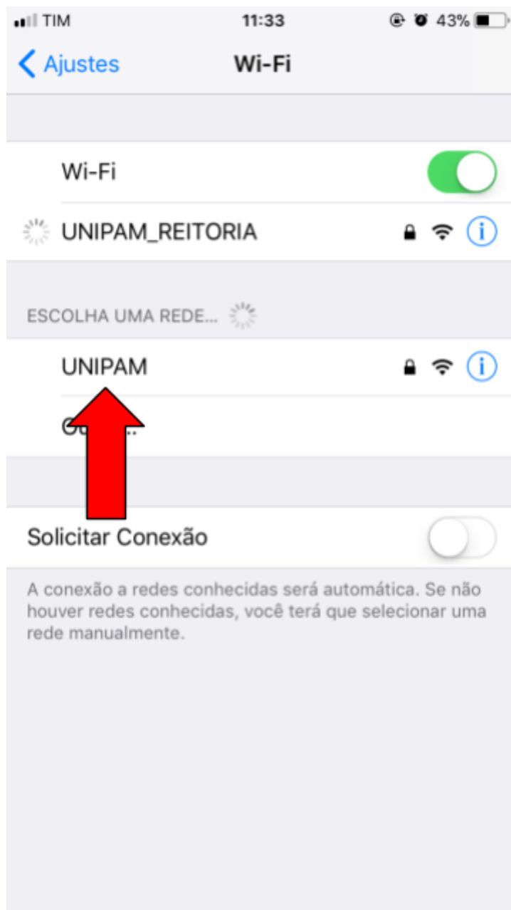
Figura 3 – Tela do iOS